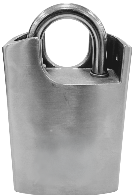
Parte trasera – Escudo anticorte de una cara