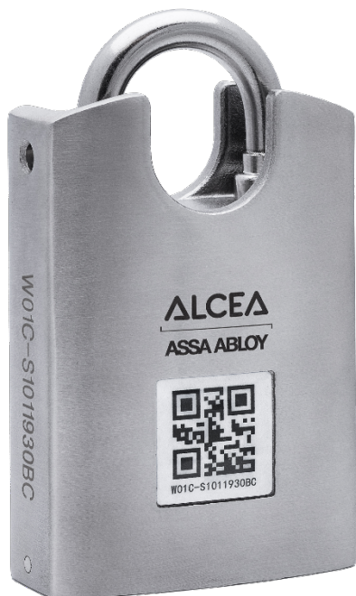
Parte delantera – Escudo anticorte de doble cara